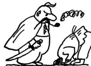
Андрей, увидев Тараса Бульбу, опустил голову в землю.