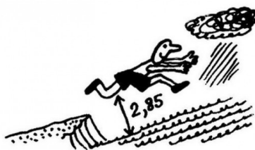
Прыгун взял высоту 2,85 м над уровнем моря.