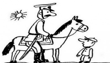
Перед ним, сидя на коне, стоял всадник.